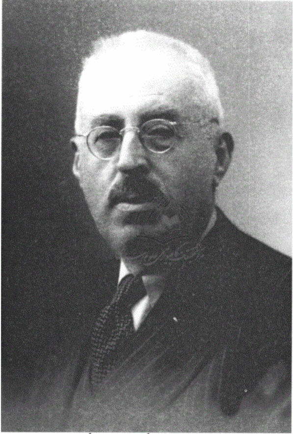
صاحب العطفة الأمير شكيب أرسلان